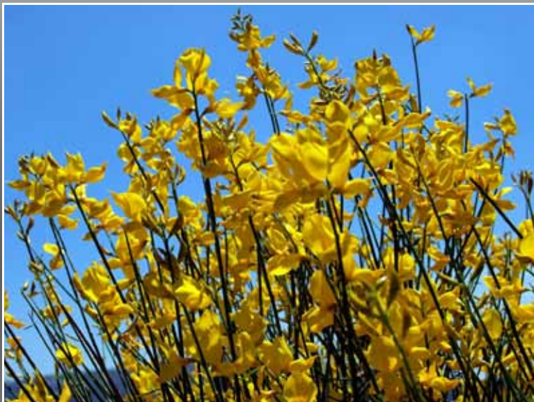
Brnistra - Spartium junceum L.

Glasilo župe Uznesenja Marijina 20243 Kuna - tel./ fax 020/742 033 Izdaje: Župni ured Kuna - Pelješac E-mail: zvonadelorite@gmail.com Tisak: □topgrafika□, Velika Gorica Za internu uporabu, izlazi povremeno