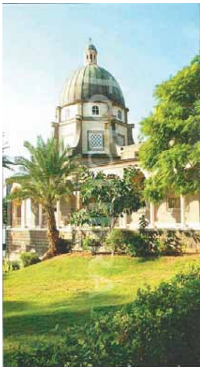
Brdo Blaženstava: Mjesto Isusova Govora na Gori gdje Isus održao glasoviti govor na ovom mjestu

Za vrijeme boravka u Jeruzalemu (Judeji) bili smo na Maslinskoj gori, kapeli Uzašašća, crkvi Očenaša, crkvi Gospodinova plača, crkvi sv. Petra od pijetlova pjeva, dvorani Posljednje večere (Cenakolo), bazilici Kristova groba, crkvi Marijina groba, crkvi Marijina uzašašća, crkvi sv. Ane i u brojnim drugim kapelama kao i u