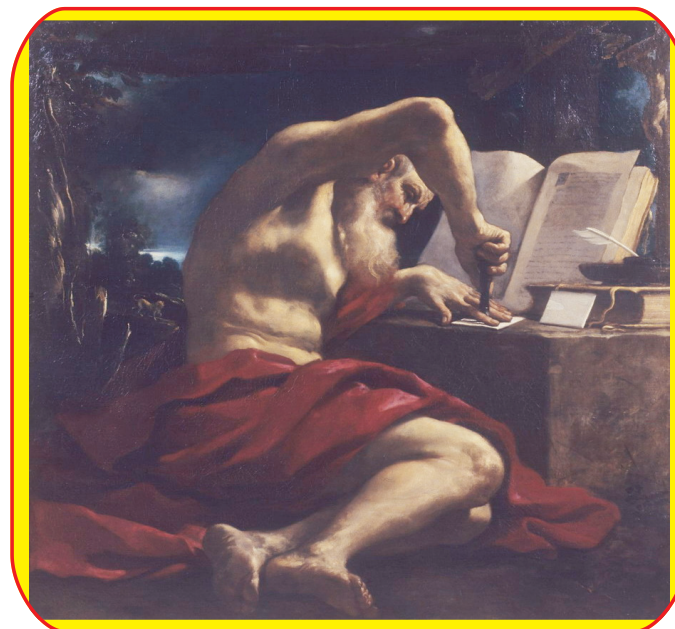
Sv. Jeronim zapečaćuje jedno pismo (Guercino, 1591.-1666.)

Ako moliš, govoriš ti Bogu; ako čitaš (Riječ Božju), govori Bog tebi.