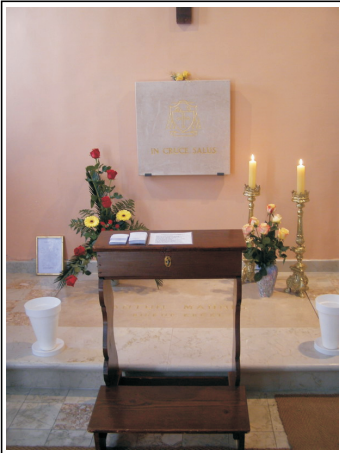
Grob biskupa Mahnića u krčkoj katedrali

Koji živiš i kraljuješ u vijeke vjekova. Amen.