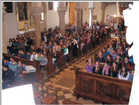
Hodočašće djece na grob biskupa Mahnića 13. travnja 2013.