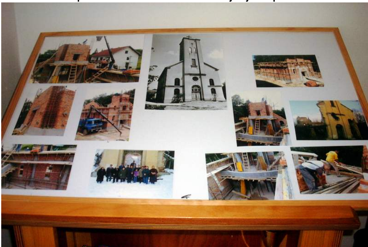
Ovako je tekla gradnja crkve 2009. U sredini je crnobijela fotografija stare crkve snimljena 1960.-tih godina