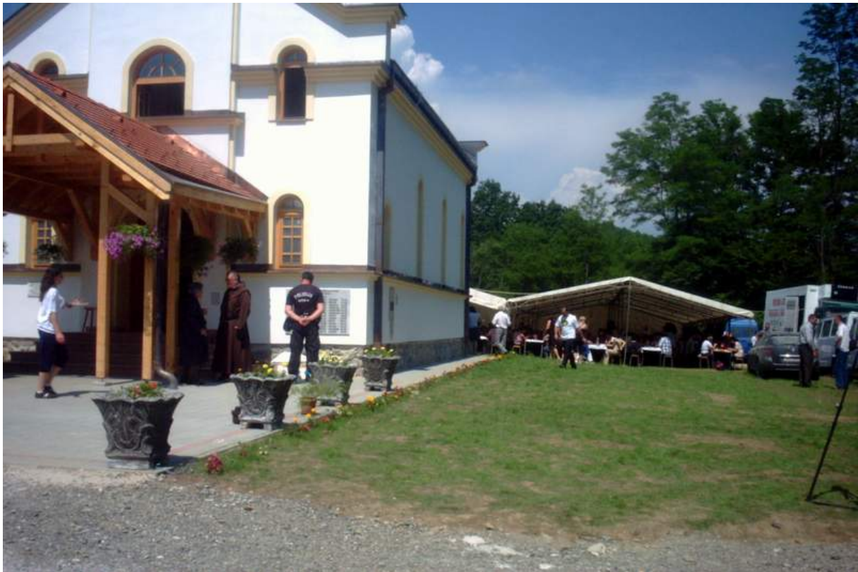
Na ručku je bilo 800 sjedećih mjesta pod šatorom. Bilo je više od tisuću nazočnih. Dokaz je gdje čeljad nije bijesna i kuća nije tijesna