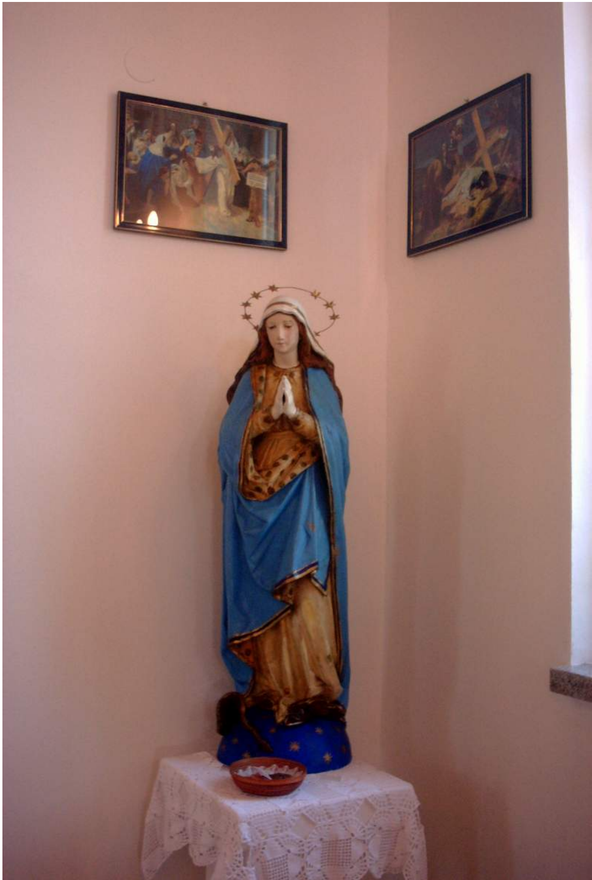
Kip Male Gospe iz poruštene crkve ostao je sačuvan