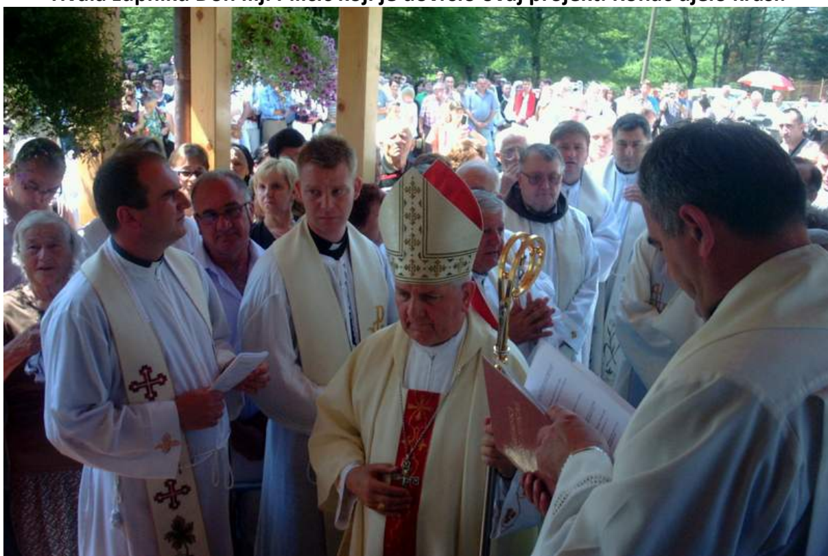
Hvala biskupu Franji Komarica neumornom mirotvorcu koji je sa svećenicima u procesiji došao otvoriti i blagosloviti i posvetiti crkvu, oltar i svetohranište. Svima HVALA!