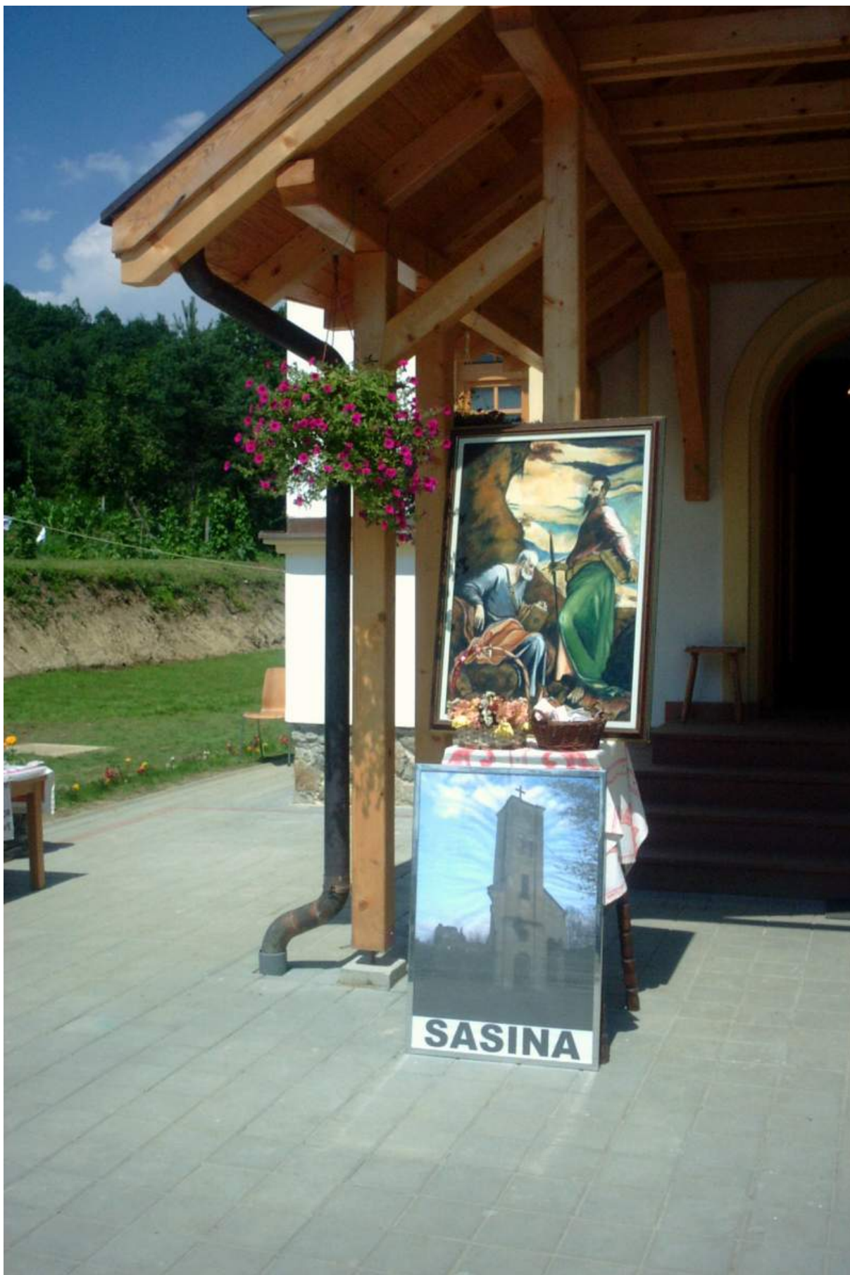
Sv. Petar i Pavo suzaštitnici župe Sasina i fotografija zvonika minirane crkve