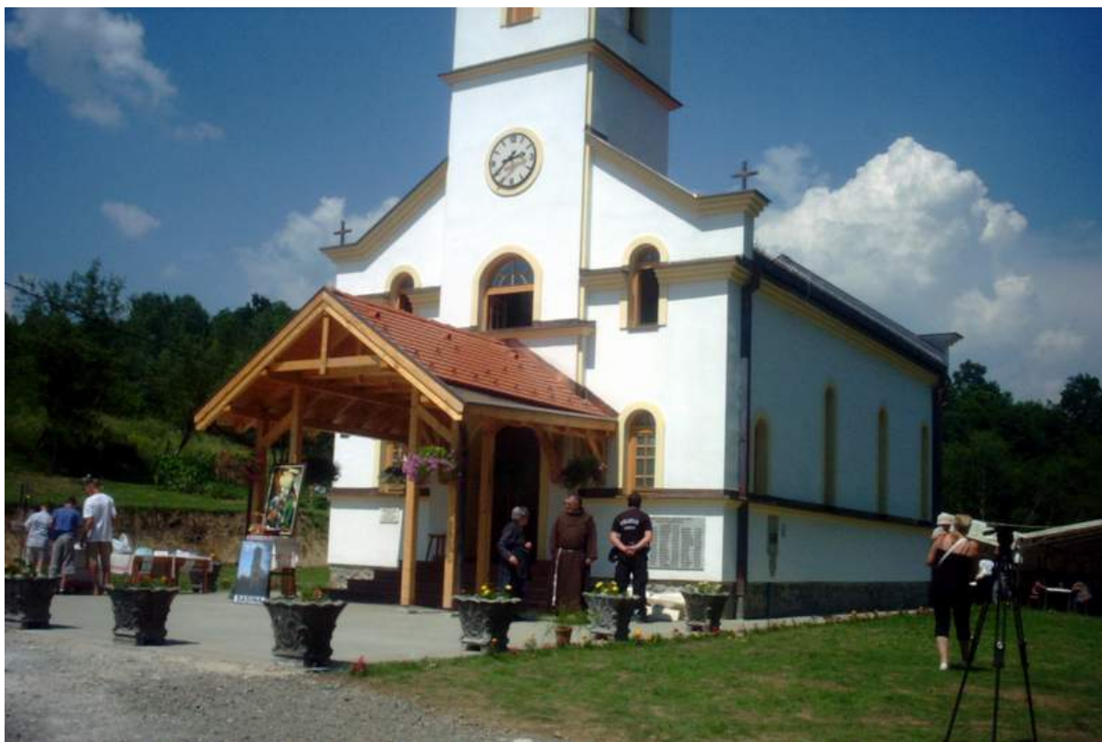
Naša ljepotica župna crkva Male Gospe u Sasini blagoslovljena i posvećena 3. srpnja 2010. u 11 sati