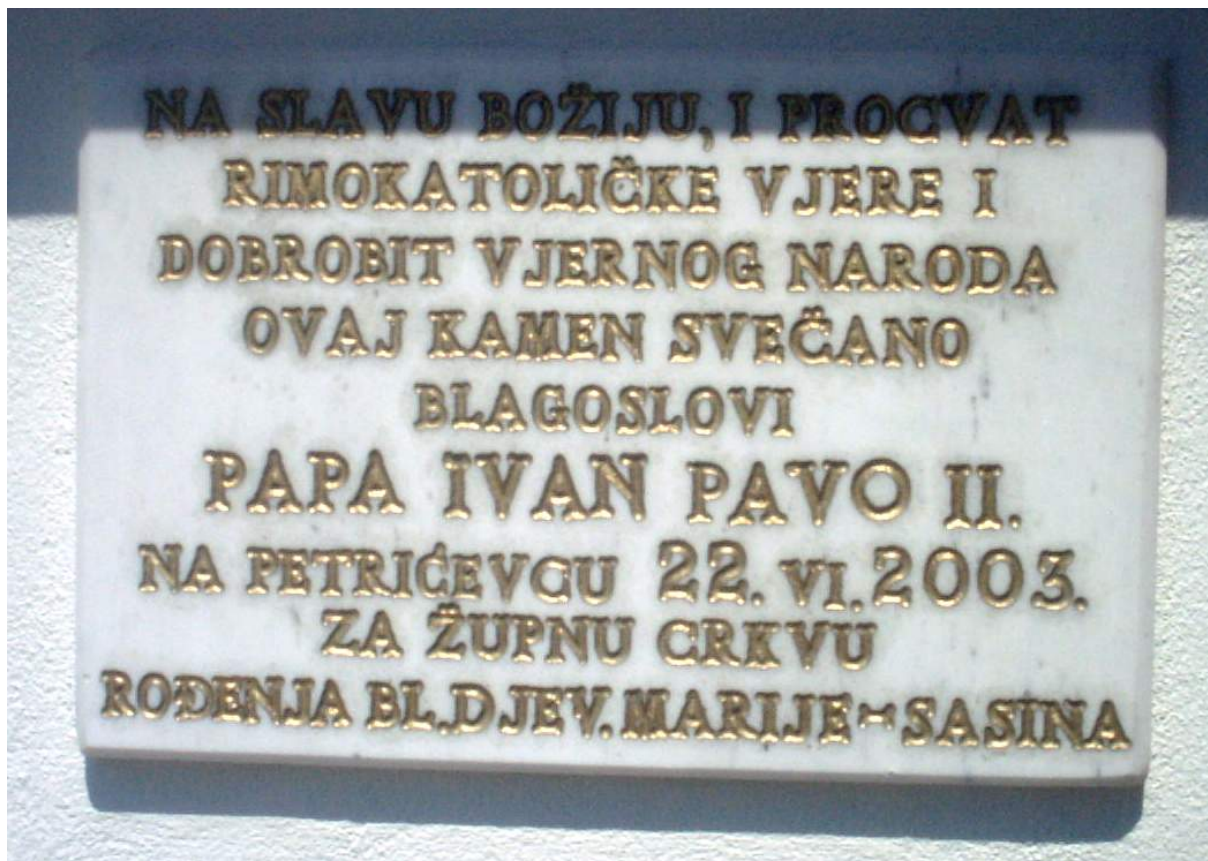
Kamen temeljac je blagoslovio Ivan Pavao II