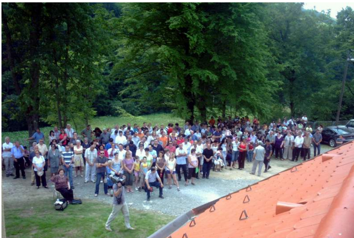
Ispred crkve preko 1000 nazočnih