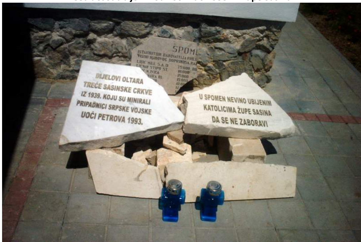
Dijelovi oltara minirane crkve 28. lipnja 1993.