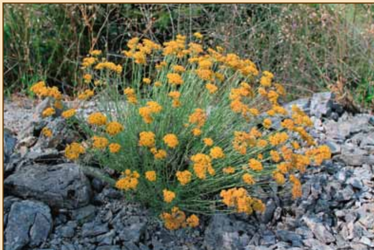
Smilje - Helichrysum italicum

Glasilo župe Uznesenja Marijina 20243 Kuna - tel./fax 020/742 033 Izdaje: Župni ured Kuna - Pelješac E-mail: zvonadelorite@gmail.com Tisak: □ topgrafika □ Velika Gorica Za internu uporabu, izlazi povremeno