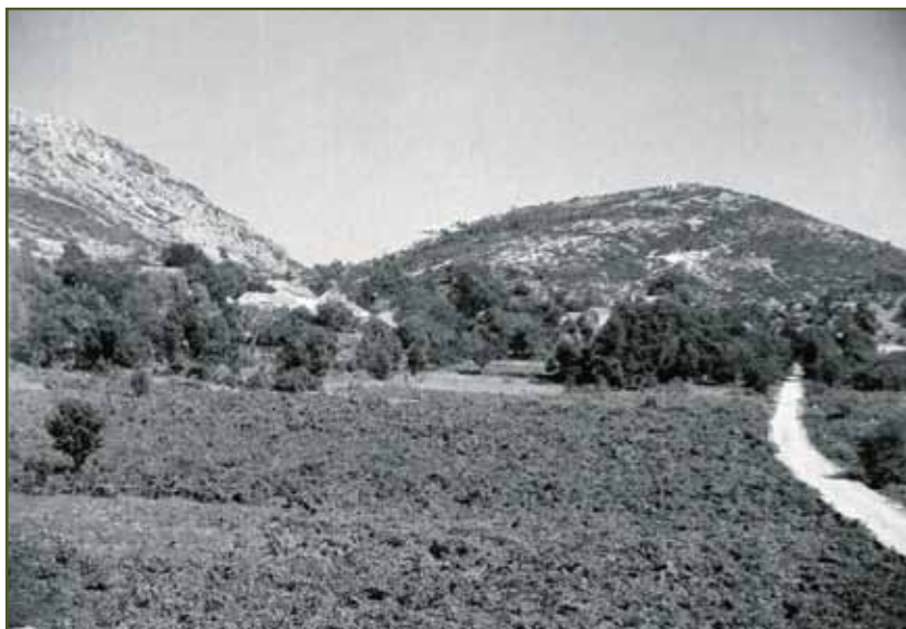
1953. - gore: Pijavičino, dolje: Potomje