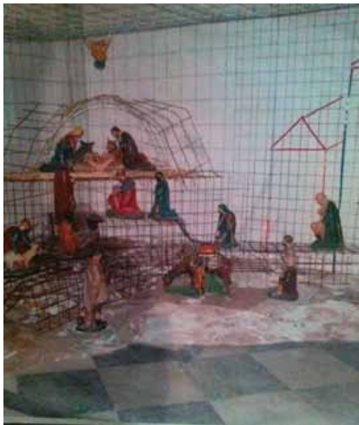
autor: Ivica Čolić