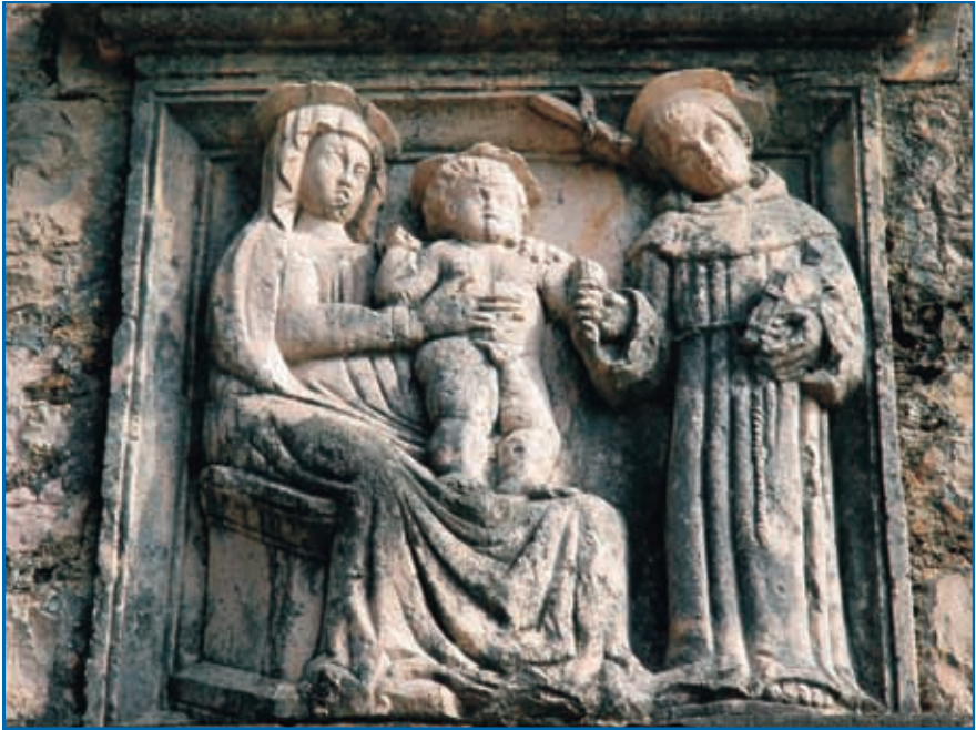
Orsan franjevačkog samostana Velike Gospe - Podgorje