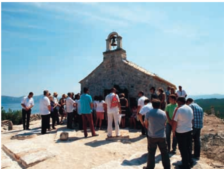
OSOBJAVA 9. 8. 2015. - Obnovljena crkvica sv. MARTINA biskupa