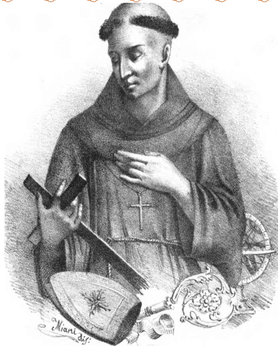
Božić str 7

Octavii effigies hoc est, nitet inclita scriptis