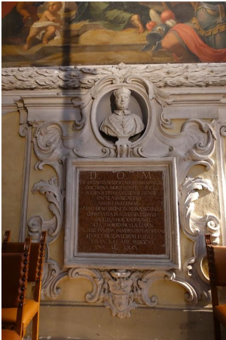
Grób u kapeli u Prociunkuli, CAPPELLA DEL ROSARIO.