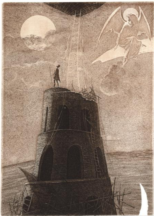
3/19 Tower of Babel P. Valjavec

I konačno, ovo lažno jedinstvo, temelji se na toleranciji. Moralni i prirodni zakoni se odbacuju u korist varljivog koncepta „prava“. Dakle, kada se nešto drži „ispravnim“ onda se to mora tolerirati. Ovakvo lažno trojstvo u sebi ne posjeduje ljubav kao svoj kraj, nego je to ego - nova kula Babilonska.